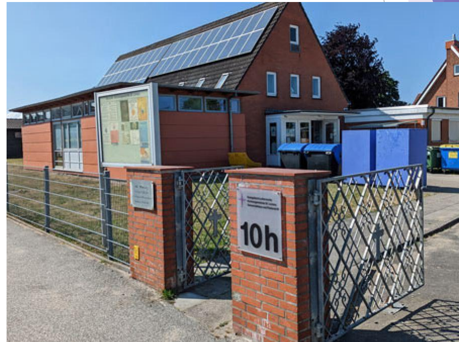
Teutendorfer Weg 10 h / 23570 Lübeck