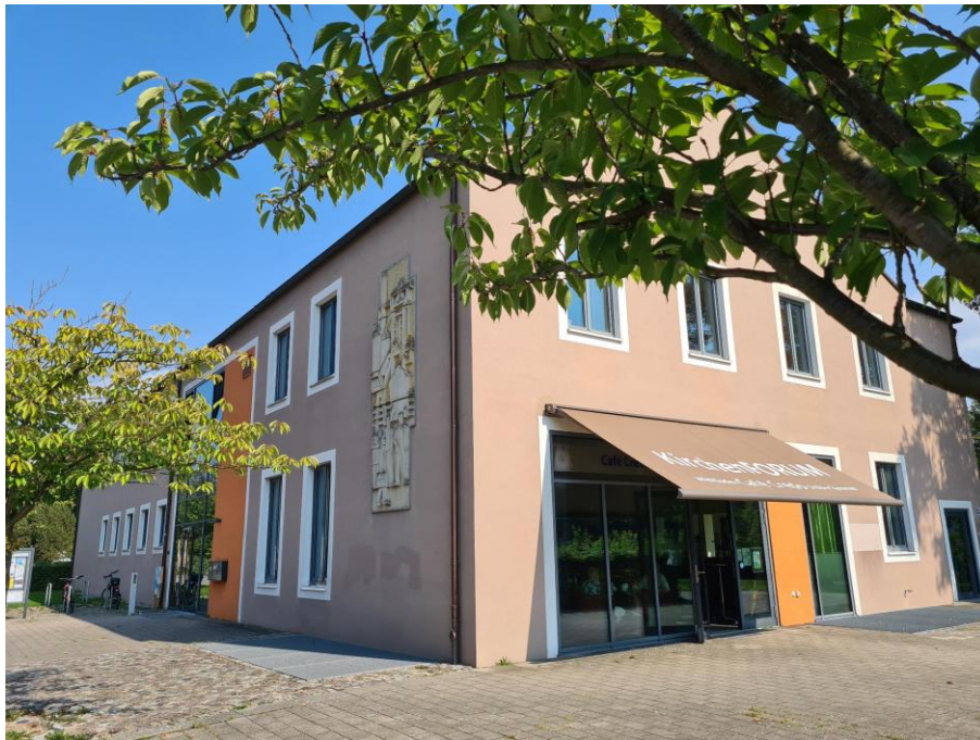
Straßenfeld 2 / 23569 Lübeck